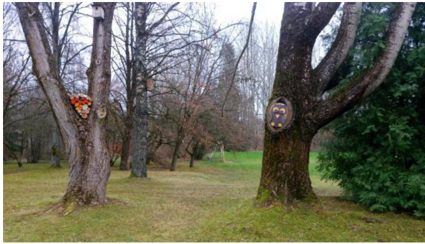
Raguvos gimnazijos parkas