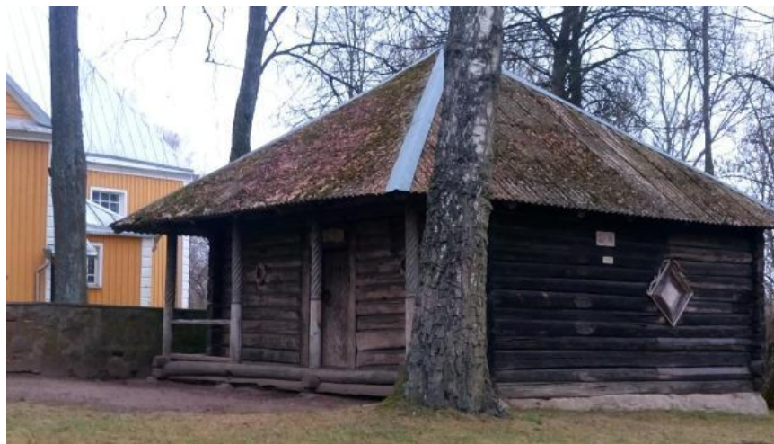
Raguvos gimnazijos teritorija